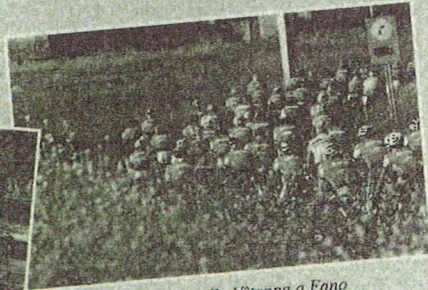
Pedalata con i clienti alla V a tappa a Fano

scorsa che sottolinea il crescente entusiasmo della community Mediolanum per iniziative di carattere sportivo e di intrattenimento che contribuiscono a rafforzare il legame "personale" con la propria banca. Nel dettaglio, sono stati oltre 1.200 i clienti e gli ospiti accolti presso le aree Hospitality di partenza e